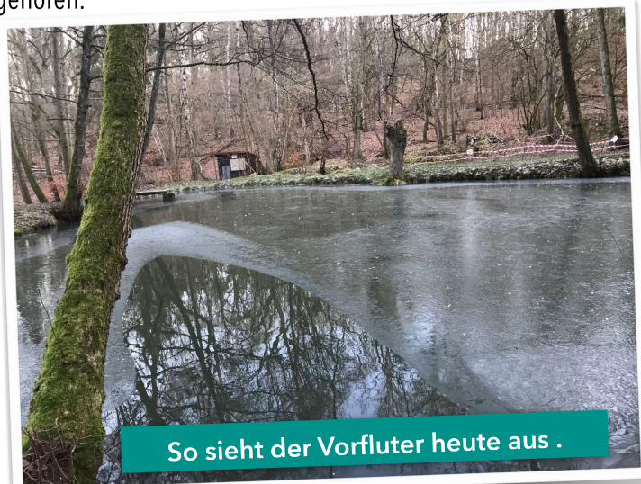
So sieht der Vorfluter heute aus .

Nachdem die Baggerarbeiten abgeschlossen sind, ist die Teichanlage endlich wieder ein einem vernünftigen Zustand. Ausser einer Undichtigkeit am Zufluss des unteren Teiches ist hier alles in Ordnung - auch die Bäume sind bisher geblieben, wo sie hingehören.